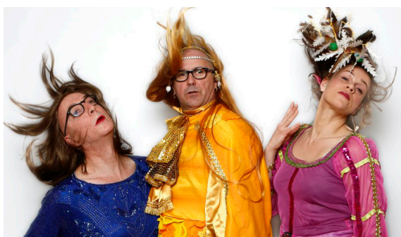
FLEUR de FRED TOUSCH - (Théâtre de rue) à 14h30

La commune de Marcille-Robert et l'association «Rue des Arts» vous proposent le dimanche 5 septembre, deux spectacles qui auront lieu sur le site de la Minoterie, ou, selon la météo, à la salle polyvalente. Buvette sur place (gérée par la Minoterie) - Passe sanitaire obligatoire.