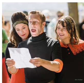
GIRAFE SONG (Chanson théâtralisée) à 17h00